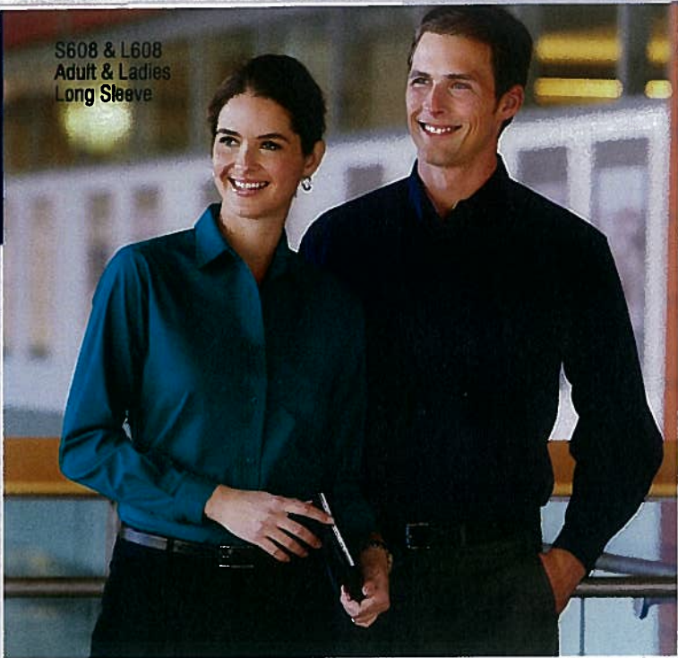
S608 & L608 Adult & Ladies Long Sleeve